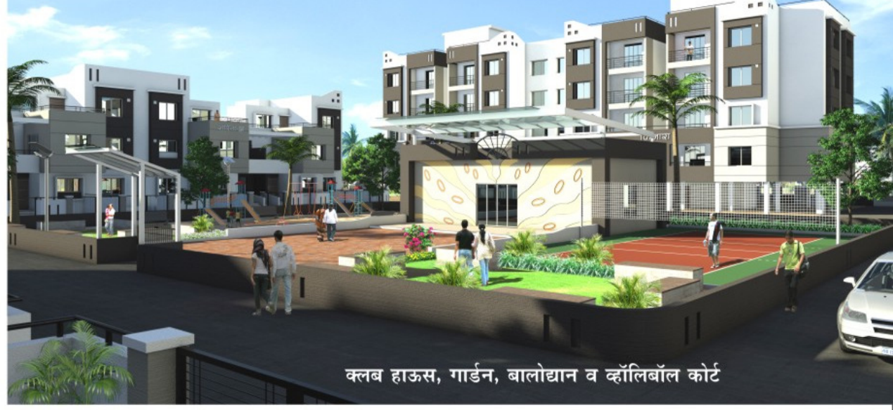
क्लब हाऊस, गार्डन, बालोद्यान व व्हॉलिबॉल कोर्ट