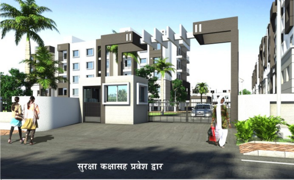
सुरक्षा कक्षासह प्रवेश द्वार